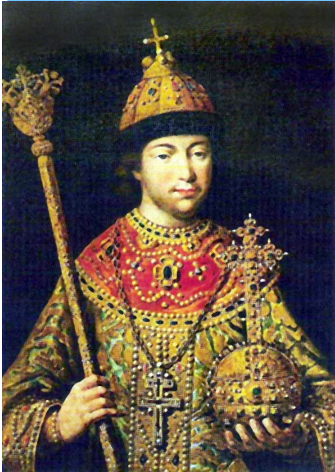
Михаил Федорович (1613-1645), первый царь династии Романовых